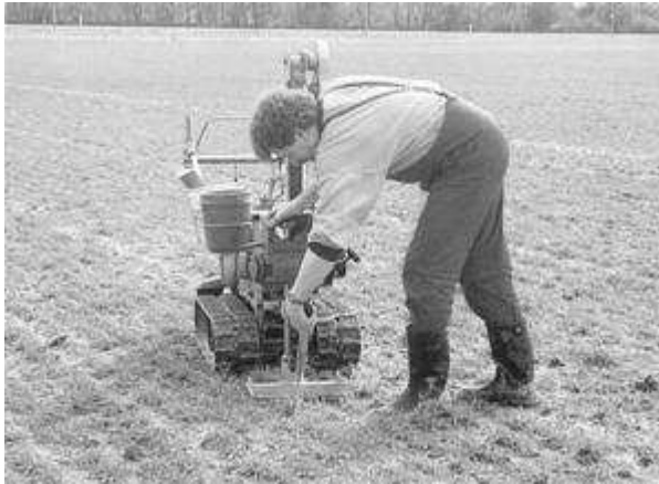
Ziehen von Bodenproben für die Bestimmung des Nitratgehaltes

Bodenerosion, insbesondere auf hängigen Flächen, Einhalt geboten wird.