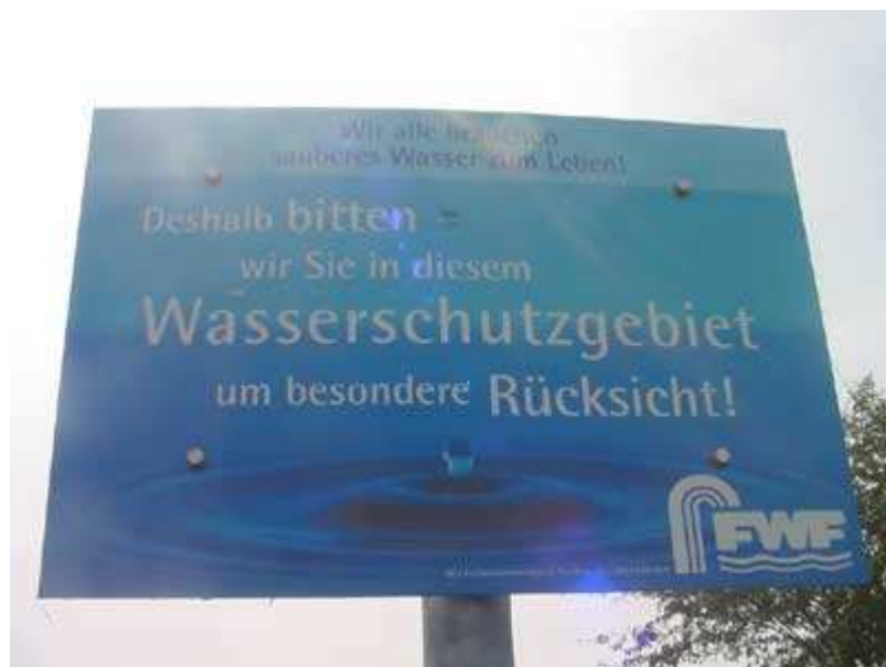
Hinweis auf Wasserschutzgebiet

einer ganzen Reihe von Faktoren ab, wie der Temperatur, der Feuchtigkeit, der Durchlüftung (z. B. Sand gegenüber Tonboden), die vom Landwirt nur wenig beeinflusst werden können. Daher kommt im Wasserschutz dem Vorsorgeprinzip große Bedeutung zu. Dies soll nachfolgend an der Kultur von Mais aufgezeigt werden.