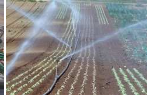
Gemüseanbau mit Bewässerung

Etwa 75 % des Wasserverbrauchs werden in unserem Lande aus dem Grundwasser gewonnen. Und neben der Industrie, Abfall- und Abwasseranlagen sowie Altlasten steht die Landwirtschaft am Pranger, wenn es um die Sauberkeit des Grundwassers geht.