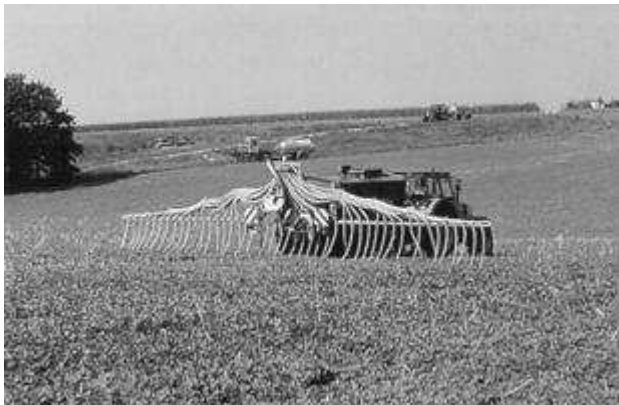
Gülleausbringung in Zwischenfrüchte