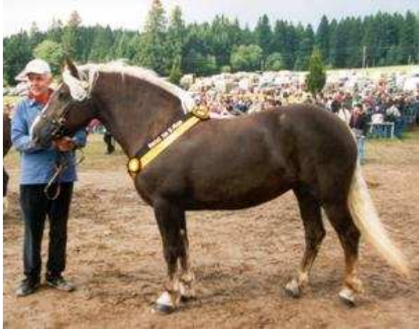
Schwarzwälder Fuchsstute