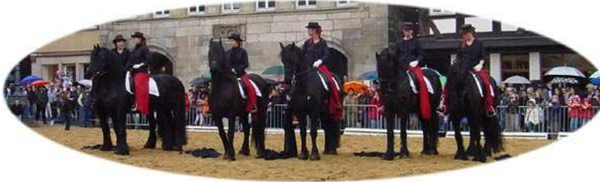
Foto: Pferdemarkt in Schwäbisch Gmünd

fast 200.000 Pferde gezählt. 1970 waren es nur noch knapp 29.000 Pferde. Seit 1972 ist eine stetige Aufwärtsentwicklung aufgrund der Nutzung der Pferde zur Freizeitgestaltung sowie im Leistungssport zu beobachten. Bei der Viehzählung 2001 wurden etwa 62.200 Pferde in Baden-Württemberg erfasst. Insgesamt geht man von einem Bestand von 90 000 Pferden aus. Die Pensionspferdehaltung nimmt einen immer größeren Stellenwert in den landwirtschaftlichen Betrieben ein.