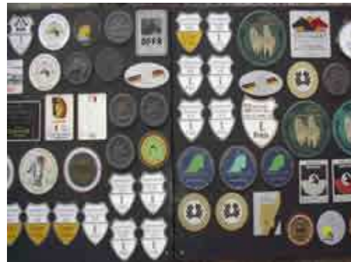
Preistafeln in Marbach