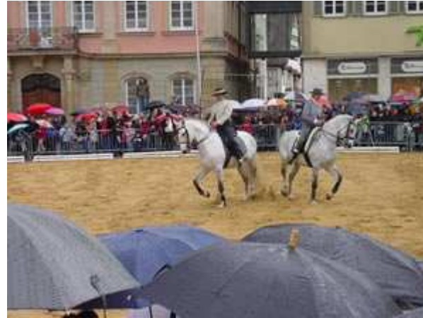
Pferdemarkt in Schwäbisch Gmünd

Im ganzen Land gibt es Pferdemarkte oder Rossfeste bei denen man mit pferdebegeisterten Menschen ins Gespräch kommen kann. Manche von ihnen haben vielleicht noch mit Pferdegespannen in der Landwirtschaft gearbeitet.