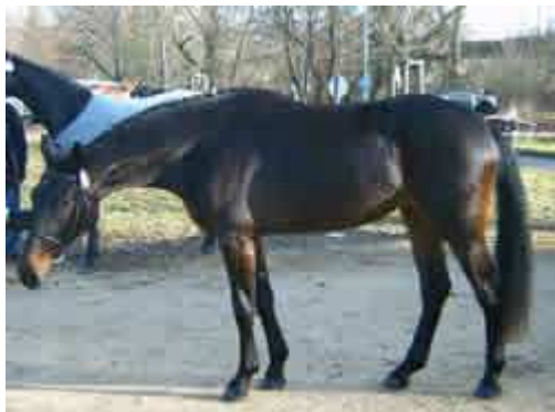
Pferdemarkt in Ellwangen

Jahrhunderte lang spielte das Pferd für den Transport als Zugpferd eine wirtschaftlich entscheidende Rolle. Heute hat die sportliche Nutzung des Pferdes die größte Bedeutung.