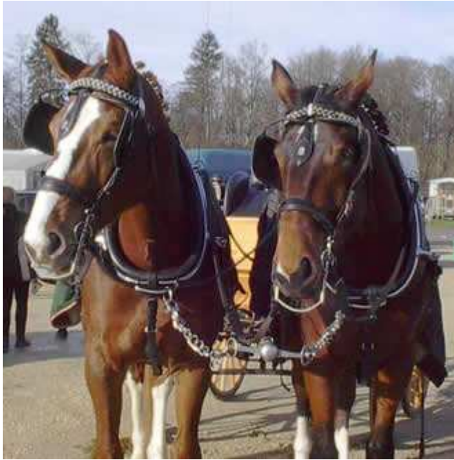
Pferdemarkt in Ellwangen ⌘ Wechselbild: Haupt- und Landesgestüt Marbach.