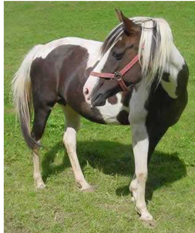
① Neuigkeiten vom Pferd für Kids

Der Grundgedanke einer "Müslifütterung" ist, die Pferde vielseitig und naturnah zu ernähren, wenn die Weide nicht ausreicht. Wobei zu beachten ist, dass Heu heute durch die mehr oder weniger starke Düngung