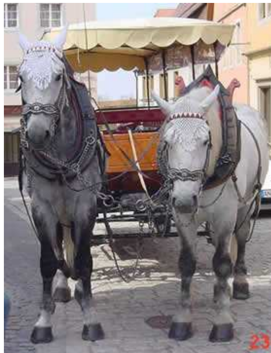
Touristentransport & Pferdetransport

Das gesündeste Futter für Pferde ist viel gutes Heu, Hafer und Mineralfutter und Vitamine.