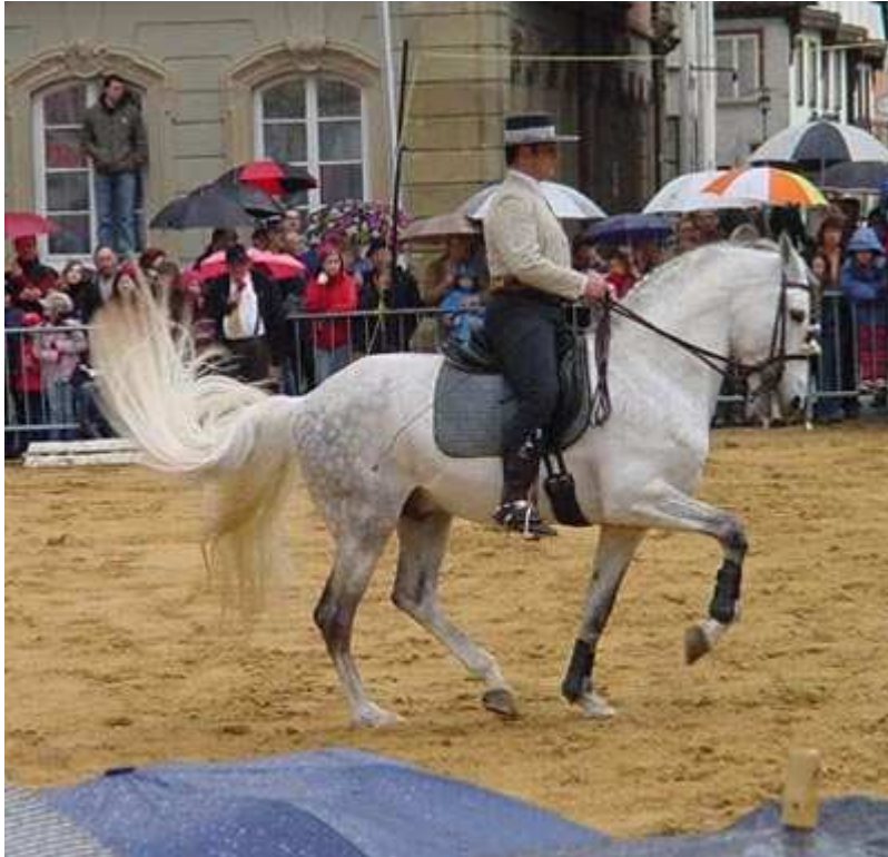
⌘ Pferdemarkt in Schwäbisch Gmünd