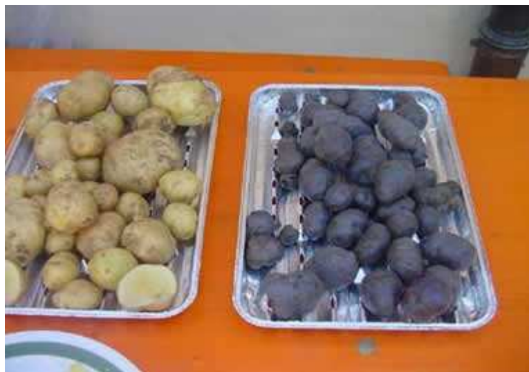
Kartoffeln Blaue Odenwälder Deutsche Sorte, 1908 gezüchtet. Schalenfarbe: blau - violettFleischfarbe: weiß, mehligkochend. Knollenform: plattrund mit tiefen Augen.