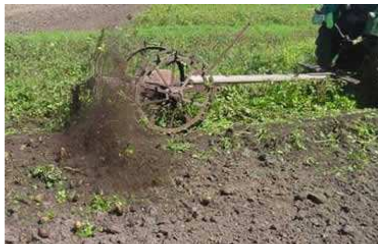
Kartoffelroder in Aktion