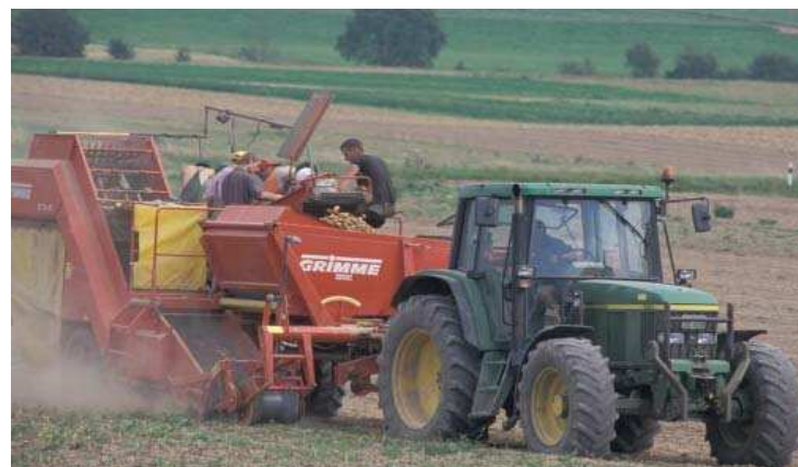
Kartoffelvollernter BLE,Bonn/Foto:Dominic Menzler