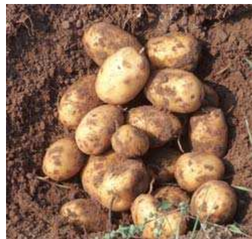
Kartoffeln frisch aus dem Boden