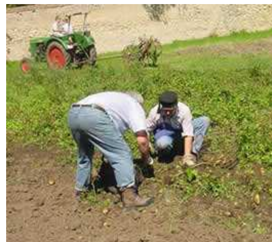
Kartoffellese von Hand