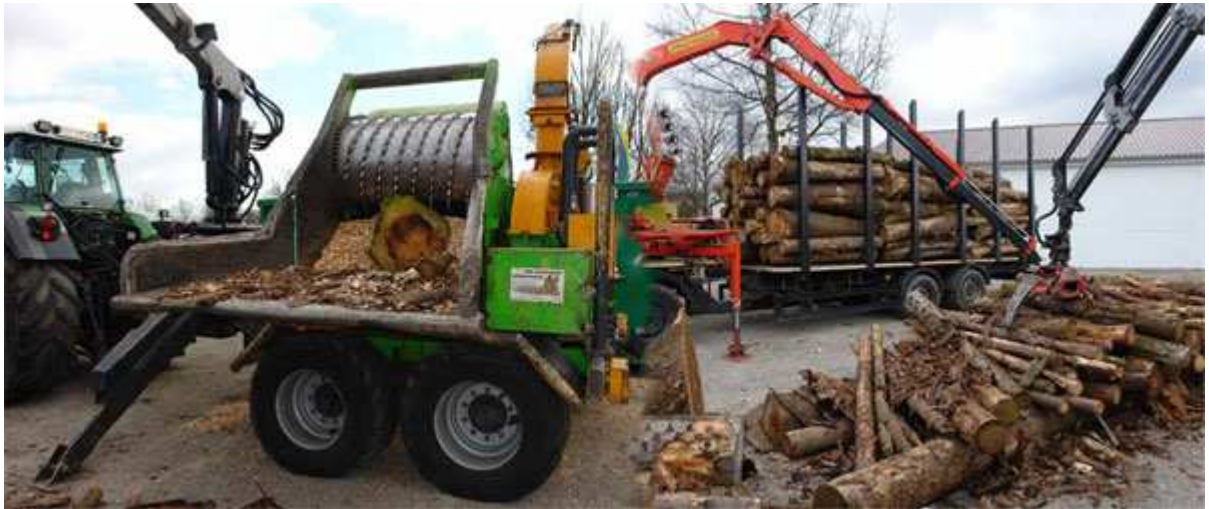
Produktion von Holzhackschnitzeln

Heizen mit Holz ist ein verantwortungsvoller Umgang mit der Umwelt. Bei der Holzverbrennung wird die gleiche Menge Kohlendioxid freigesetzt, die auch bei der natürlichen Verrottung des Holzes entsteht. Bäume bilden aus Sonnenlicht und Kohlendioxid den Kohlenstoff für das Wachstum (Photosynthese). Gleichzeitig erzeugt der Baum Sauerstoff für unsere Atemluft. So schließt sich der Kreislauf und die Natur bleibt im Gleichgewicht.